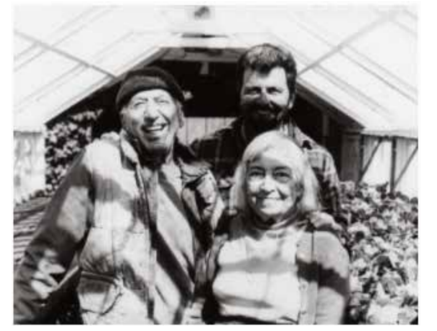
Inmigrantes armenios que se establecieron y practicaron la agricultura en West Andover.

El área de Boston se convirtió en un centro importante de asentamiento armenio como resultado de los esfuerzos tempranos de los misioneros por impulsar la migración, y una gran cantidad de armenios se establecieron in Watertown, MA. En la década de 1910, refugiados del genocidio armenio también comenzaron a asentarse y practicar la agricultura en West Andover, lo que derivó en el establecimiento de varias granjas armenias a lo largo de Chandler Road.