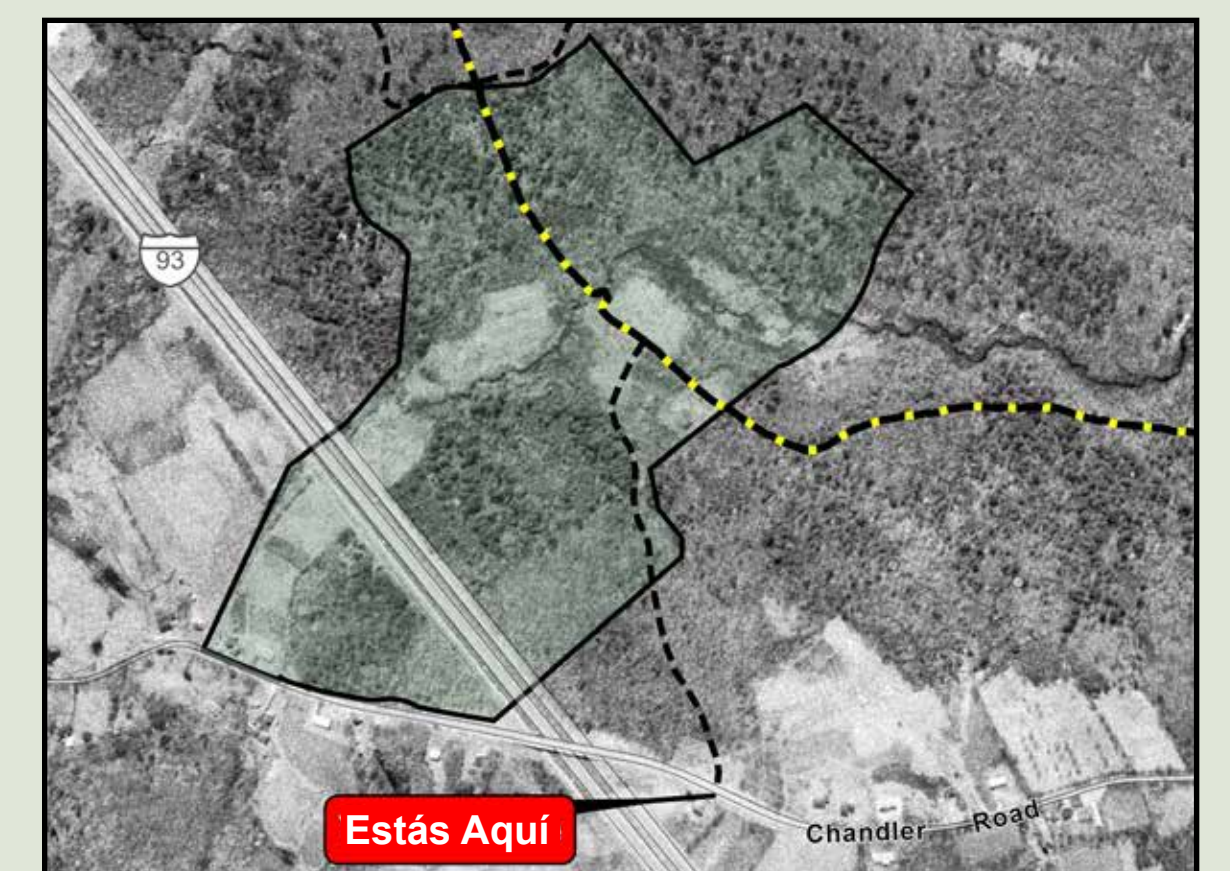
La propiedad Boloian fragmentada en 1965, tras la construcción de la autopista I-93.